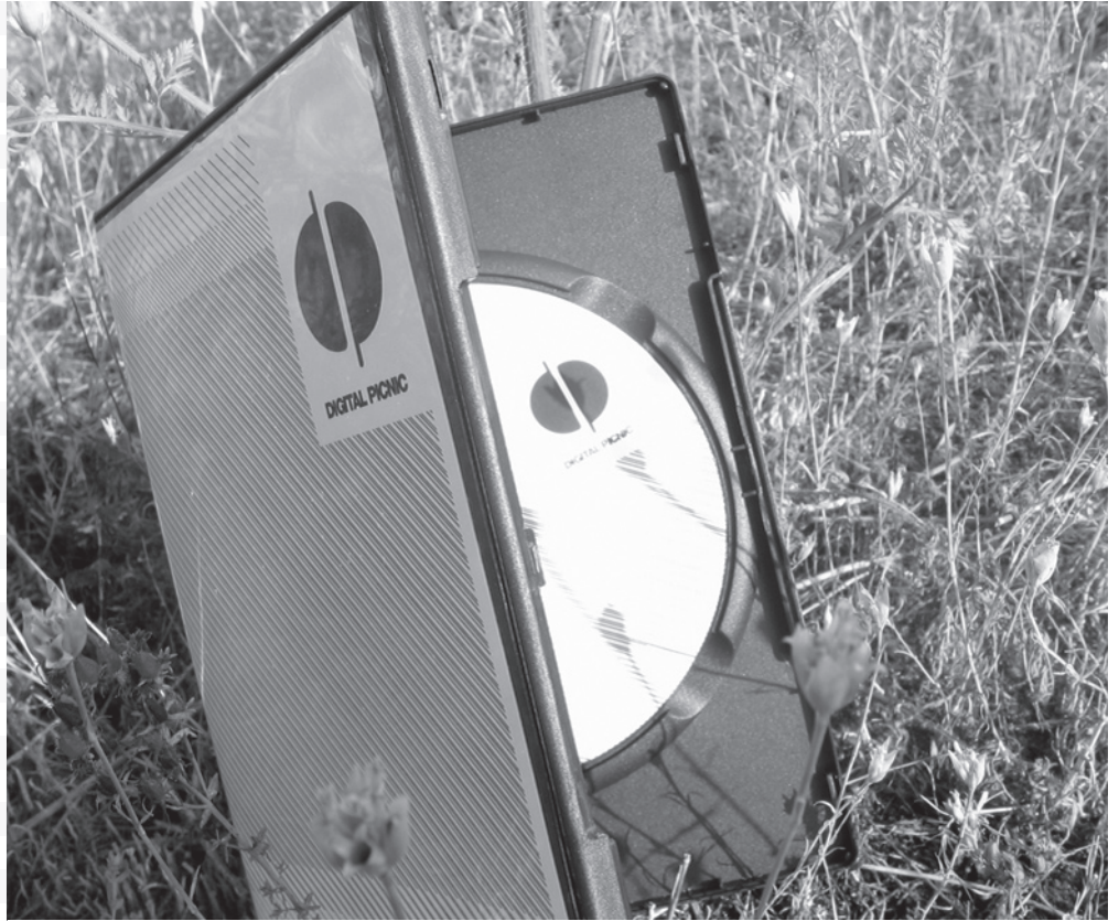
digital picnic DVD