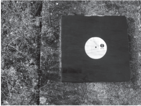
digital picnic Vinyl Compilation