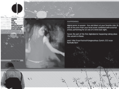
digital picnic Webseite - www.digitalpicnic.ch